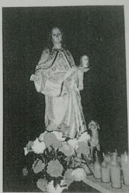
Imatge de Santa Quitèria, copatrona de Linyola